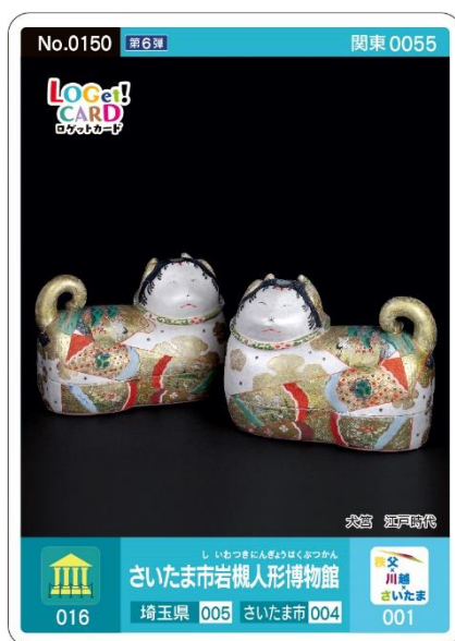
さいたま市岩槻人形博物館